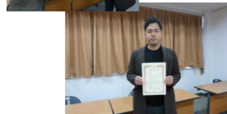
工学部にて関係者から表彰状を受けるアイデア賞受賞の代表学生