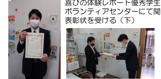
喜びの体験レポート優秀学生(左) ボランティアセンターにて関係者から表彰状を受ける(下)